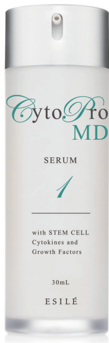
サイトプロ MD セラム

炎症ケアのエキスパートである骨髄間葉系幹細胞のサイトカイン・成長因子が傷ついた細胞に働きかけ、敏感肌ケア・エイジングケアに驚きのパワーを発揮します。