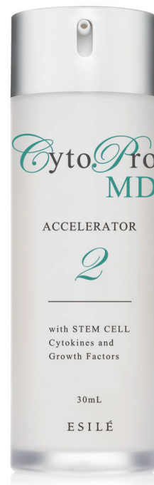
サイトプロ MD アクセルレーター

朝夜、洗顔後、セラムを塗布し30秒～1分おいた後、2プッシュを目安に手にとり、お肌にやさしくなじませます。